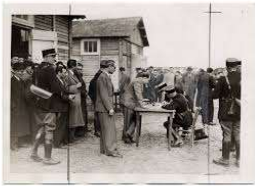
Le camp de Pithiviers

Le camp de Pithiviers est construit en mars 1941, il occupe un terrain de 5 hectares dans un faubourg de la ville à proximité de la gare , alors qu'au début il est utilisé pour stocker les prisonniers de guerre, il se transforme en camp d'internement le 14 mai 1941 (le billet vert) avec l'arrivée de plus de 1700 juifs étrangers de la région parisienne....Plusieurs convois partiront de Pithiviers, 5860 hommes, femmes et enfants.... seuls 115 survivront.